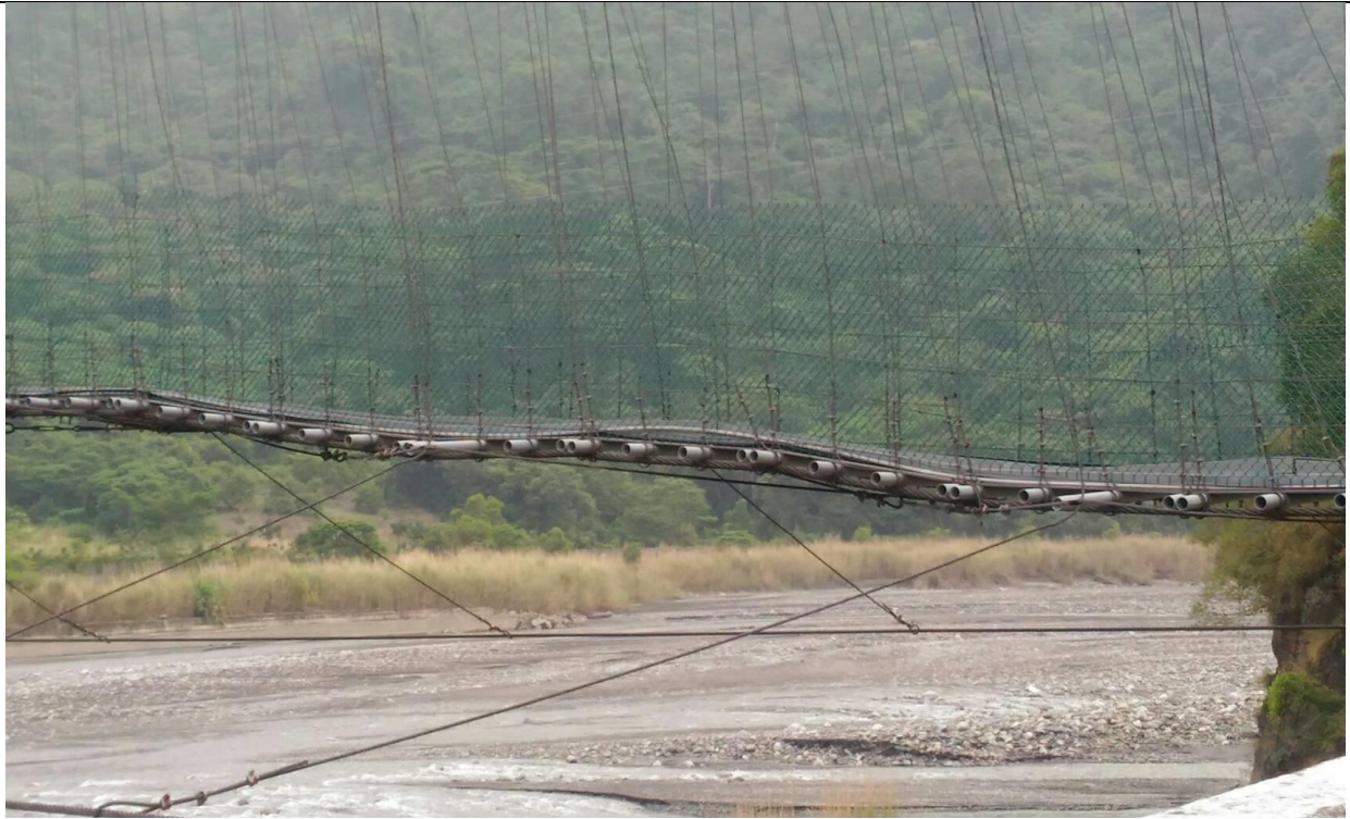
得樂日嘎大橋護欄、布魯布沙吊橋及公所前擋土牆原住民特色繪圖美化案