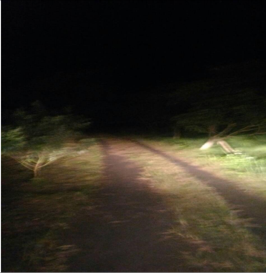
茂林里第一鄰裝設路燈案