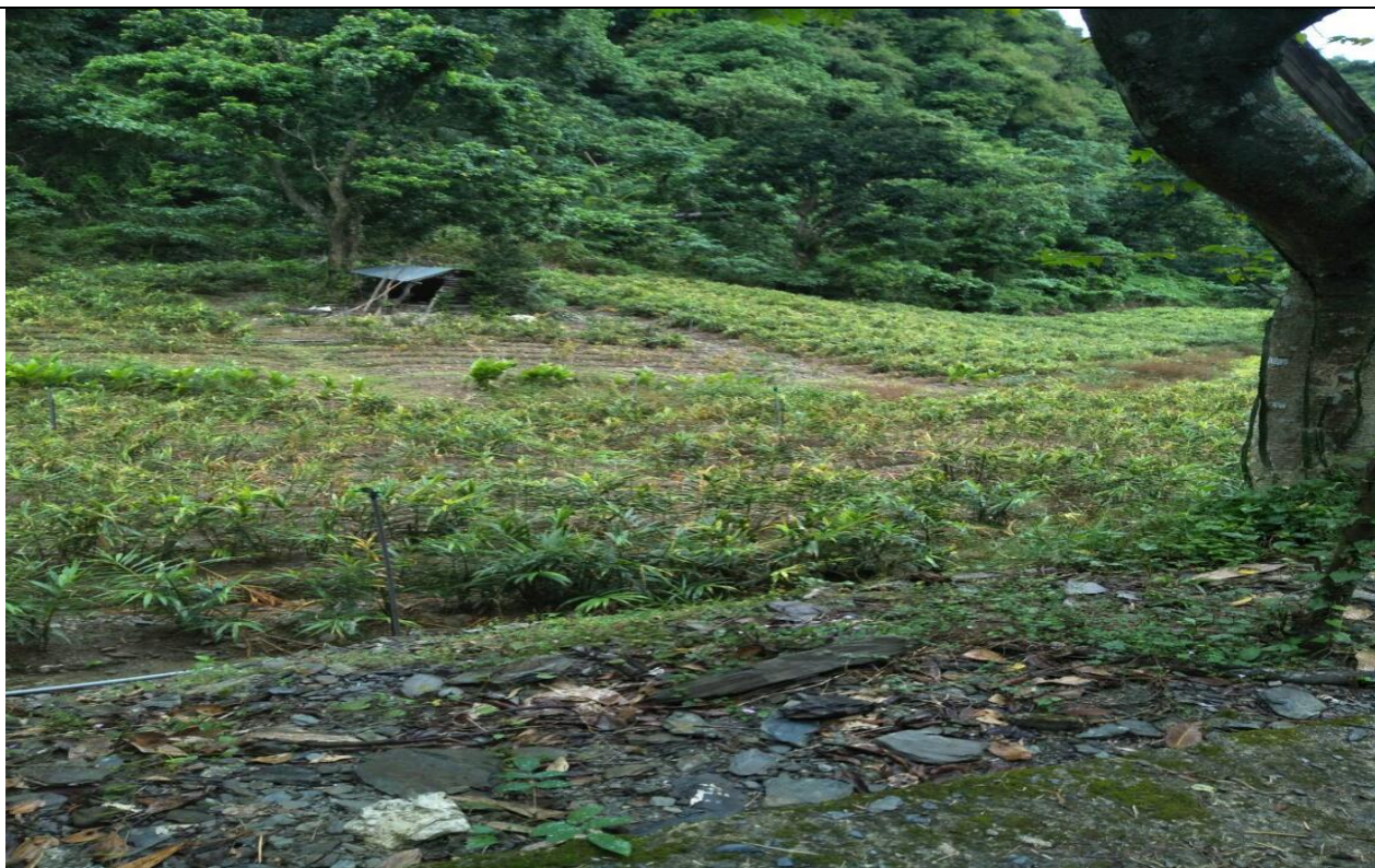
紅塵峽谷農路施作排水溝及增設涵管案