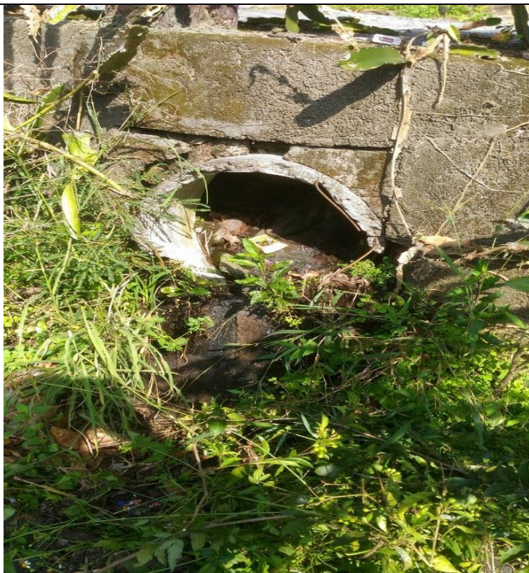
茂林安親班下方排水溝出水口阻塞及排水溝淘空