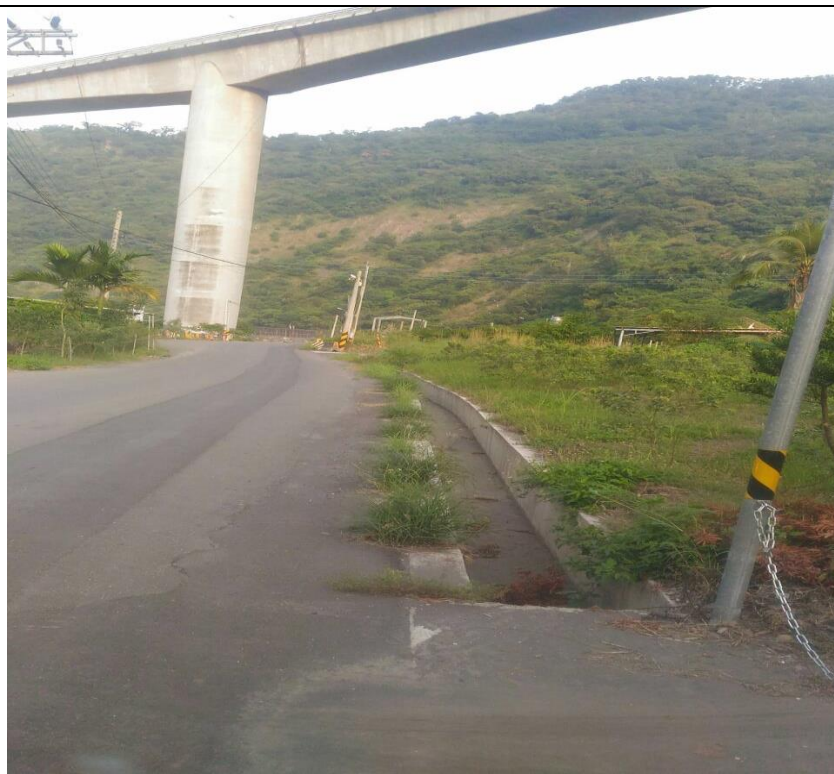
情人谷聯絡道路排水溝加格柵板案